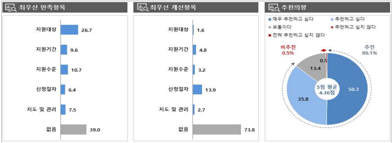
[그림 1] 사회적기업 육성(균특) 만족/개선 항목 및 추천 의향